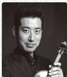
井上 隆平 ヴァイオリン