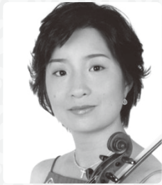
谷口 朋子 ヴァイオリン